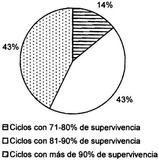
FIGURA 1. Cantidad de ciclos de cultivo (%) según la supervivencia alcanzada en los tanques con menos de 60.000 células/ml.