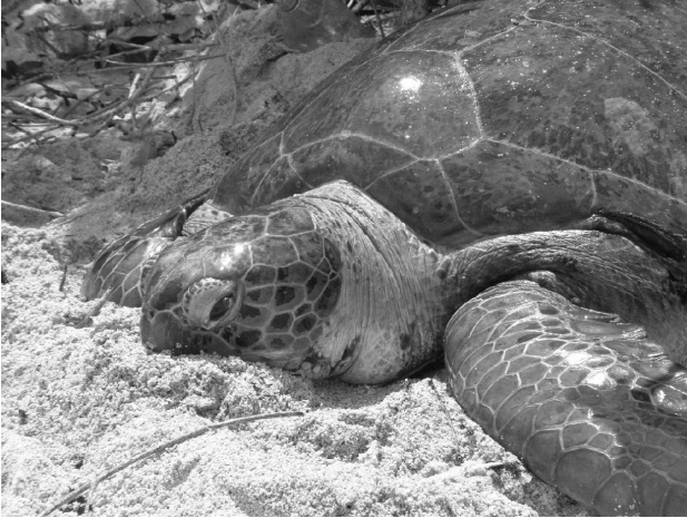
Figura 4. Tortuga verde viva ( Chelonia mydas ) después de liberarse de atascamiento en manglar, en Mayorquina, Zona de Protección Integral del Parque Nacional Morrocoy (07/06/2008).

arenoso (de 0,939 km de longitud), registrándose 12 salidas con nido, siendo la mayor parte de la tortuga carey 11,9% (n=10) y el resto de tortuga verde 2,38% (n=2) (Fig. 5); una única salida sin nido correspondió a la tortuga carey. En esta localidad la densidad fue de 13 ni-