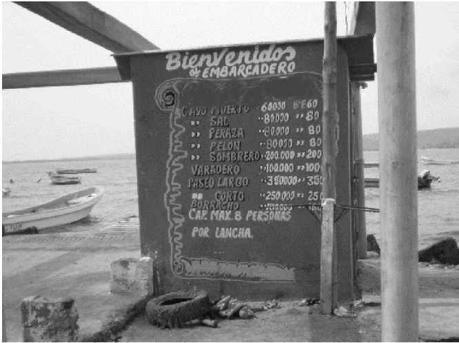
Figura 6. Anuncio de una asociación de lancheros de Chichiriviche, en la cual se observó la oferta de traslados a Cayo Borracho (05/06/2008).

dos/km de playa y se observó un intenso uso humano, como tránsito peatonal, fogatas, abundantes desechos y en particular, saqueo de nidadas. La remota ubicación geográfica de esta ZPI hace que la guardería ambiental sea escasa. Además fue observado que diez de las trece asociaciones de lancheros de Chichiriviche ofrecieron ilícitamente viajes turísticos a esta localidad (Fig. 6), a pesar de las restricciones del PORU. Finalmente, al norte de Cayo Sal se observó un único nido de tortuga verde.