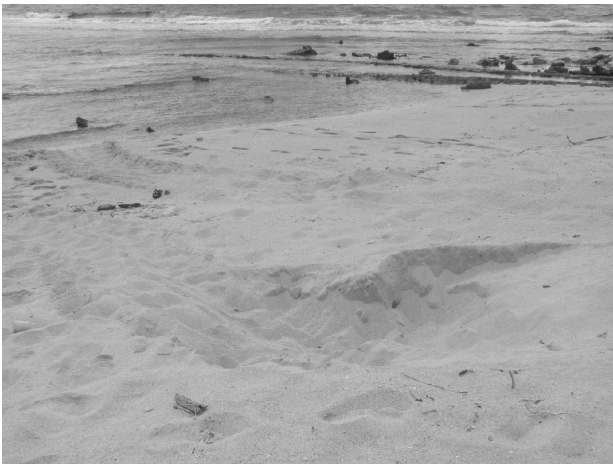
Figura 5. Salida con nido de tortuga verde ( Chelonia mydas ) en Cayo Borracho, Zona de Protección Integral del Parque Nacional Morrocoy (29/07/2008).