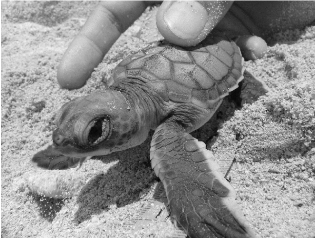
Figura 3. Cría de tortuga verde ( Chelonia mydas ) hallada en la playa de Varadero, Zona de Protección Integral del Parque Nacional Morrocoy (07/06/2008).

reproductivos solo se observaron en el sector sureste de la playa (2,04 km), entre Punta Faustino y los Peñones (Fig. 1B), donde la densidad de nidos fue de 20 nidos/km. Por otra parte, en este mismo sector fue evidente la presencia de numerosas estructuras de ocupación temporal, de construcción rudimentaria, utilizadas por pescadores locales. Cerca de dichas estructuras, en diversas ocasiones, se encontraron restos óseos de tortuga verde. Adicionalmente, se observaron 6 nidos con señales de intento de saqueo.