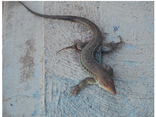
Figura 4. Ejemplar de Ameiva bifrontata insulana proveniente del Archipiélago Los Testigos. Posiblemente es la primera foto publicada de esta población.

Seis de éstos ya habían sido mencionados para el archipiélago por Ruthven (1924) y Hummelinck (1940). Ruthven (1924) describió una nueva Ameiva para el Archipiélago Los Testigos, Ameiva insulana , la cual fue luego rebajada a nivel de subespecie, Ameiva bifrontata insulana (Fig. 4). El cotejo ( Cnemidophorus flavissimus ) fue identificado como la misma especie descrita para el Archipiélago Los Frailes. La iguana común ( Iguana iguana ) la consideramos abundante, prácticamente en todas las islas que integran el archipiélago, aunque los lugareños y visitantes afectan considerablemente sus poblaciones pues consumen frecuentemente su carne y huevos. Se llegaron a cuantificar hasta 25 ejemplares de iguanas en pequeños recorridos a pie o en bote alrededor de las islas Iguana, Conejo, Rajada y Testigo Grande.