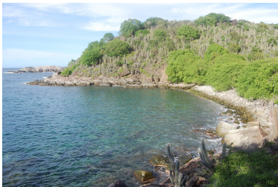
Figura 2. Sector La Charpeta, parte norte de la Isla Testigo Grande, Archipiélago Los Testigos, Venezuela.