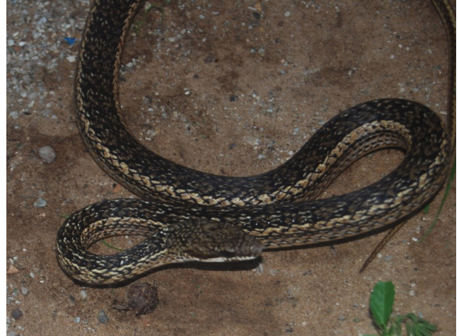
Figura 3. Ejemplar de Mastigodryas pleei proveniente del Archipiélago Los Testigos.

En este trabajo se han registrado para el Archipiélago Los Testigos nueve lagartos nativos y tres introducidos.