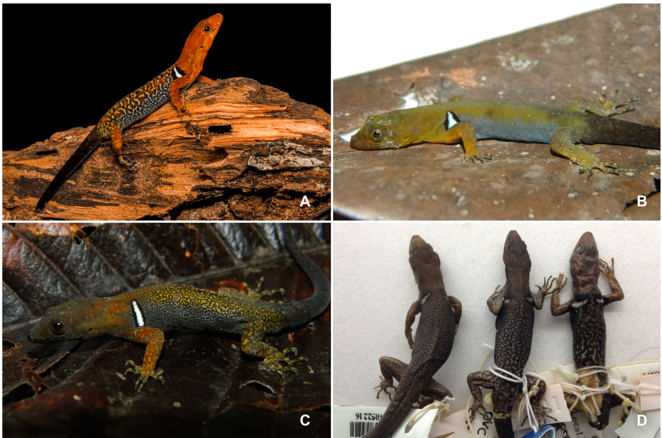
Figura 1. Gonatodes concinnatus de Colombia, departamento del Putumayo, municipio de Puerto Asís (SINCHI-R 861). (A). Gonatodes ligiae en vida. Colombia, departamento de Arauca, municipio de Arauquita (RC-1833, no catalogado) (B). Gonatodes riveroi en vida. Colombia, departamento del Meta, Villavicencio (JDL-29373, no catalogado) (C). Patrón de vermiculación en el dorso del cuerpo de gecos del complejo Gonatodes concinnatus de Colombia. Izquierda G. riveroi (ICN 3175), con patrón de vermiculación “fino”, del departamento del Meta, el Porvenir. En el centro, Gonatodes sp. (ICN-7257), del departamento del Meta, Cubaral con patrón de vermiculación “intermedio”. A la derecha, G. concinnatus (ICN-3203), con patrón de vermiculación “grosso”, del departamento de Putumayo, Puerto Asís (D).

Aunque la especie no ha tenido muchos cambios de nomenclatura desde su descripción a nivel específico, a nivel genérico tuvo un cambio, ya que fue descrita bajo el género Goniodactylus (O’Shaughnessy, 1881), posteriormente Boulenger (1885) la transferiría a Gonatodes ; el taxón recientemente fue objeto de estudio, bajo el nombre de complejo Gonatodes concinnatus (Sturaro & Avila-Pires 2011),