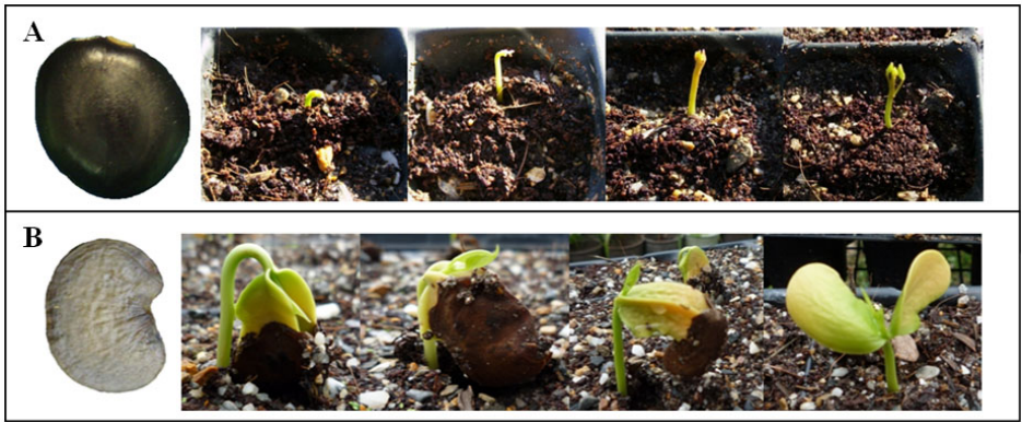
Figura 2. Secuencia de la germinación y emergencia de la plántula en: (A) Pithecellobium dulce , germinación hipógea-plántula criptocotilar; (B) Platymiscium diadelphum , germinación epígea- plántula fanerocotilar.