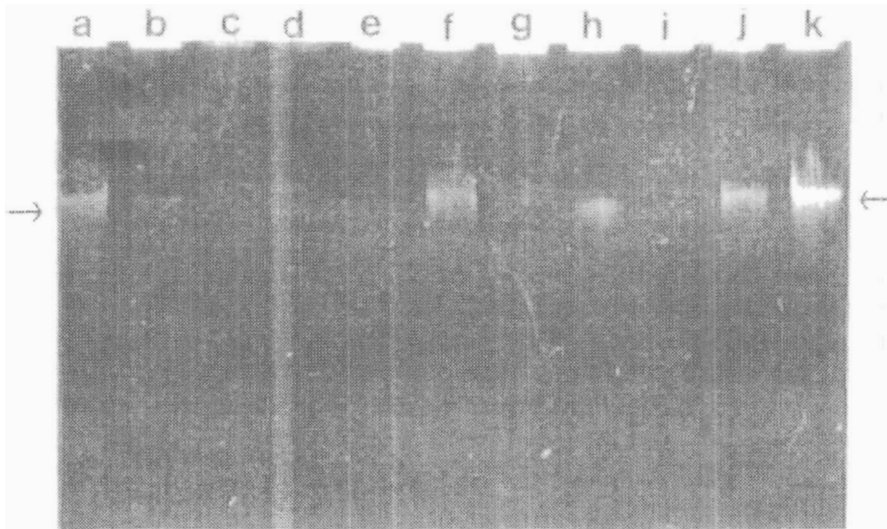
Figura 2. Electroforésis en gel de agarosa de aislados de las cepas de R. meliloti : (a) 41 y (b) L530; (k) A. tumefaciens ; Bradyrhizobium sp.; (c) 505; (d) 505; (e) 508; (f) 2004; (g) 2006; (h) 2007; (i) 2011; (j) 2012. Las flechas indican la posición de los plásmidos de las cepas de R. meliloti 41 y L530 y A. tumefaciens C58.