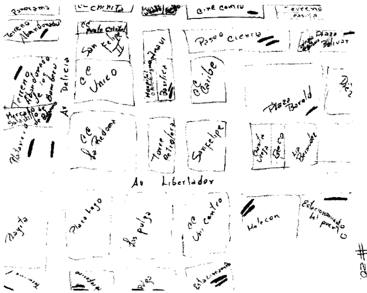
Fig.8. "Mapa Cognitivo de Bohonera del eje "Pulgas/Playitas" con ego dibujante en el eje".

Simultáneamente, el método reposa en la obtención de información relativa, a través de tres lenguajes: el orogestual, en el desarrollo de la observación; el textual, en la respuesta de la escala de Lickert; y el gráfico, en el mapa cognitivo. Entre otras ventajas, este procedimiento híbrido permite esquivar posibles contradicciones del entrevistado, convirtiéndolas incluso en aliadas del analista para el esclarecimiento de discursos escondidos, discursos explícitamente manipulados, o de la tensión entre etic y emic, tan característica también entre las descripciones densas. En el caso del Centro de Maracaibo, la investigación nos condujo a aspectos relativos a la distinción social e, incluso, al clasismo, a través de discursos que se analizarán puntualmente