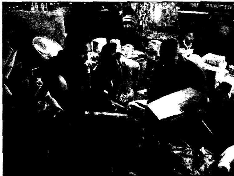
Fig.2. "Buhoneros de las Pulgas después de la faena".

Las ideas e impresiones sobre el Centro, rescatadas aquí desde los diferentes discursos, tienen un sentido sociocultural y son ordenadas, en buena medida, por las situaciones que se producen a partir de la estructura de clases en Venezuela. Así, tanto en los campos culturales de la clase media, como en ciertas construcciones, fundamentalmente, del discurso de los no usuarios , bien sea del Centro en su totalidad, o bien de algunos de sus ejes territoriales, se alimenta una visión negativa y negadora que, posteriormente, activa políticas, identidades locales, conflictos, jurisprudencia, etc. El caso de los proyectos "Buchones Mall" y "Paseo de los Gaiteros" parece ser emblemático de estas proyecciones, pero deberán ser tratados puntualmente en otras investigaciones