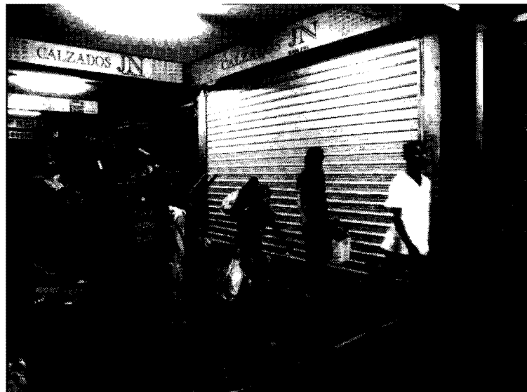
Fig 3. "Familia atravesando San Felipe de noche".

Es por eso que partimos de la obra de Foucault para esta investigación: el uso de nuestro concepto articulador, la conciencia negativa de la cultura popular , inspirado en las ideas de la conciencias positiva y negativa de la ciencia, permite que los resultados de nuestra investigación no sólo arrojen la fotografía de una situación descrita, sino que apunta a comprender procesos estables y nucleares de las verdades construidas histórica, política y epistémicamente en torno al clasismo, así como en torno a otras formas de exclusión, ahora ya correspondientes al Espacio Público Venezolano. Esta óptica no desatiende de modo alguno la importancia de la situación ni supone que está sujeta a determinaciones económicas en todos sus aspectos, pero tampoco pierde de vista la riqueza