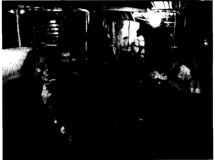
Fig.1. Las Pulgas de noche

Si bien, aun en la década de 1960, el puerto embarcaba a los trabajadores petroleros y las actividades comerciales que se desprendían de las actividades portuarias se mantenían, su incidencia como fuente de riquezas en la macroeconomía local o nacional había disminuido considerablemente (Mejías, 2001).