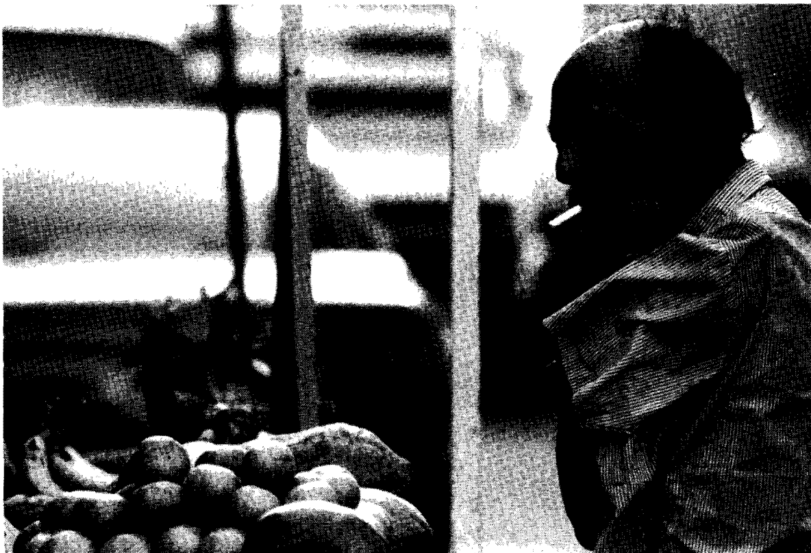
Fig 4. Amanecer en el Paseo Ciencias.

Por otro lado, los entrevistadores están formados, no sólo en la aplicación de las técnicas descritas, sino en rudimentos de la observación etnográfica. Así, el dibujo del mapa produce una determinada información y, a la vez, pretexta una conversación en la que el entrevistador puede medir y recoger en sus diarios de campo discursos y significaciones no predeterminadas.