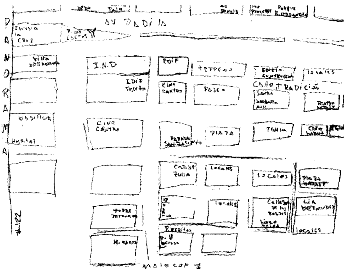
Fig.7. "Mapa Cognitivo del eje paseo ciencias/Av. libertador".

a) Los ejes cognitivos producen alteridades marcadamente diferenciadas. Es de esperar que los usuarios diurnos con ego dibujante en un eje cognitivo equivalgan al Centro con el espacio que les sirva de referencia. Si bien pueden concordar con otros informante en que los límites del Centro están más allá (generalmente, se identifican con precisión), les dificulta pensar en el Centro como un todo y lo reducen a su entorno inmediato a sus experiencias. Esto sucede fundamentalmente con los usuarios diurnos con ego dibujante del eje Paseo Ciencias/Av Libertador, tal y como se ve en el Mapa Cognitivo anexo.