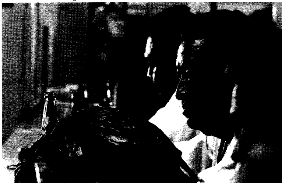
Fig.5. "Hombre con bolsa en un bar del centro".

con un buen nivel de confianza el desplazamiento de los significados en la medida en que se mantuvieron abiertas las observaciones etnográficas, y al mismo tiempo, éstas sirvieron de referencia dominante a una práctica discursiva formulada en tres lenguajes: a) las preguntas escritas de selección cerrada, en la escala de Lickert, aumentada a 10°; b) los gráficos de dibujo y color en los mapas cognitivos; y c) la oro-gestualidad, las conversaciones de la observación etnográfica, en sí. Estos tres lenguajes hacen que las posibles contradicciones del entrevistado se conviertan en aliadas del analista para el esclarecimiento de discursos escondidos, discursividades explícitamente manipuladas, o de la tensión entre etic y emic (Harris, 1987), tan característicos de las descripciones densas (Geertz, 1973).