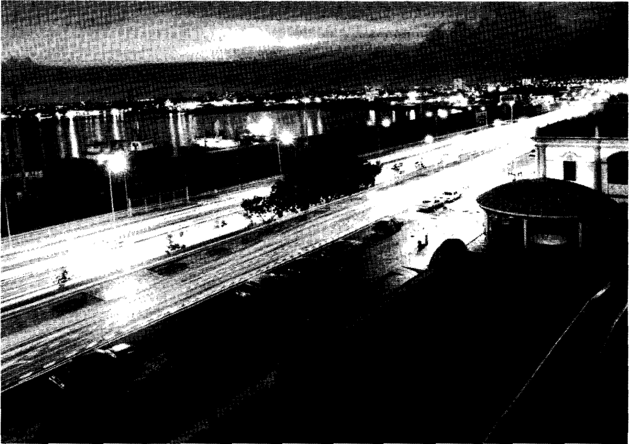
Fig. 6. "La Av Libertador y el Malecón (Altura del eje Paseo Ciencias)"

En el caso de un tema de relativamente difícil medida, como el referente a la conciencia negativa de la cultura popular, la afinación de un método que libere los obstáculos de las tensiones entre lo dicho y lo no dicho (Ducrot, 1978), se evidencia necesario. En otras palabras, partimos de la táctica consistente en hacer viajar informaciones similares por medios diferentes, para desarmar algunas de las operaciones de la ocultación, sin duda, naturales en la relación entre el sujeto y la cultura.