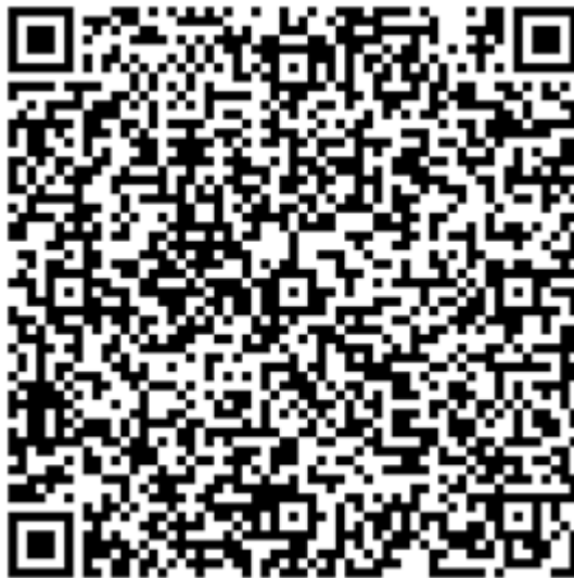
Figura 1. Imagen de Código QR